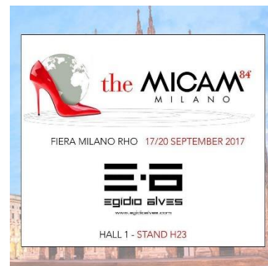
Feira MICAM, Milão setembro 2017