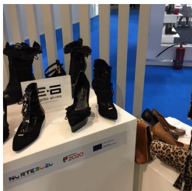
Feira MICAM, Milão fevereiro 2017

Principais atividades financiadas | Prospeção de mercados internacionais; Feira MICAM, Milão fevereiro 2017; Feira MICAM, Milão setembro 2017; Feira MOMAD, Madrid setembro 2017